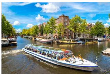
Schiff fährt durch die Grachten Amsterdams, Niederlande