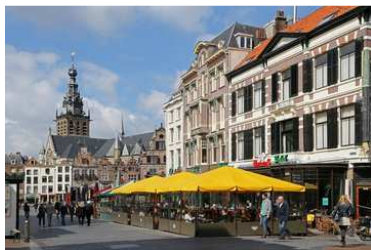
Altstadt von Nijmegen mit Stevenskerche, Niederlande

7.Tag Nijmegen / Niederlande 09:00 15:00 Nijmegen zu Fuß, Rundfahrt mit dem "Zonnetrein"