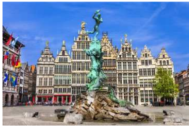
Marktplatz in Antwerpen, Belgien

6.Tag Antwerpen / Belgien 08:30 17:00 Antwerpen, Brüssel