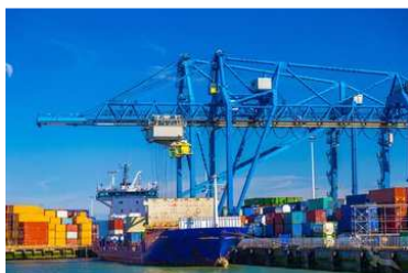
Containershipp im Hafen Rotterdams, Niederlande

4.Tag Rotterdam / Niederlande 10:30 19:30 Stadt- und Hafentrundfahrt, Delft und Den Haag