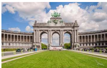
Triumphbogen in Brüssel, Belgien