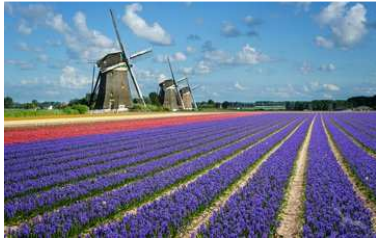
Bunt leuchten die Tulpen auf dem Keukenhof, Niederlande

Kostenlose Buchungshotline: 0391 – 5999 977 oder per Mail reisen@volksstimme.de