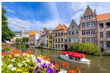
Gracht in Gent, Belgien