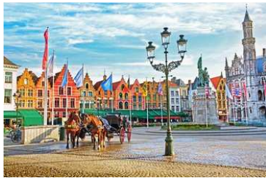
Der Groote Markt in Brügge, Belgien

5.Tag. Gent - Außenhafen / Belgien 09:30 20:00 Brügge, Gent zu Fuß (mit Transfer)