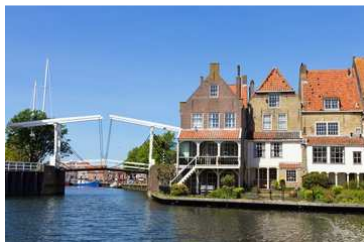
Gracht im kleinen Städtchen Enkhuizen, Niederlande

Enkhuizen zu Fuß, Zuiderzeemuseum mit Fähre