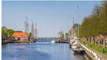
Hafen von Medemblik, Niederlande

3.Tag Medemblik / Niederlande 08:30 10:30 Medemblik zu Fuß