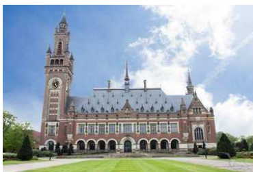
Gerichtshof in Den Haag, Niederlande