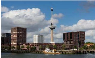
Der Euromast überragt den Hafen Rotterdams, Niederlande

Kostenlose Buchungshotline: 0391 – 5999 977 oder per Mail reisen@volksstimme.de