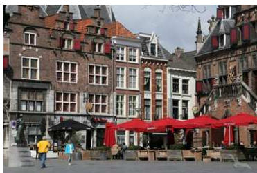
Zentraler Platz Nijmegens, Niederlande